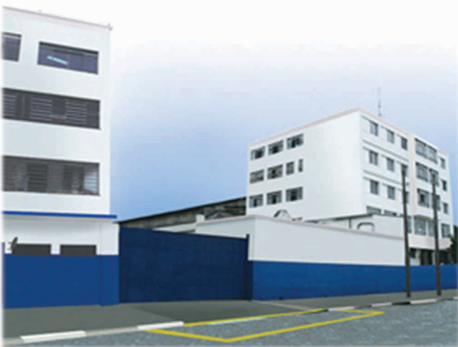
São Paulo – São Paulo – Brasil