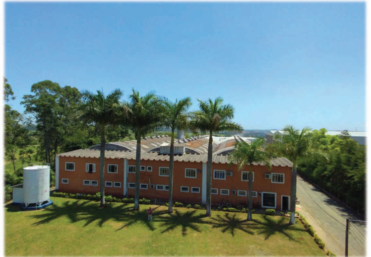
Porto Feliz – São Paulo – Brasil