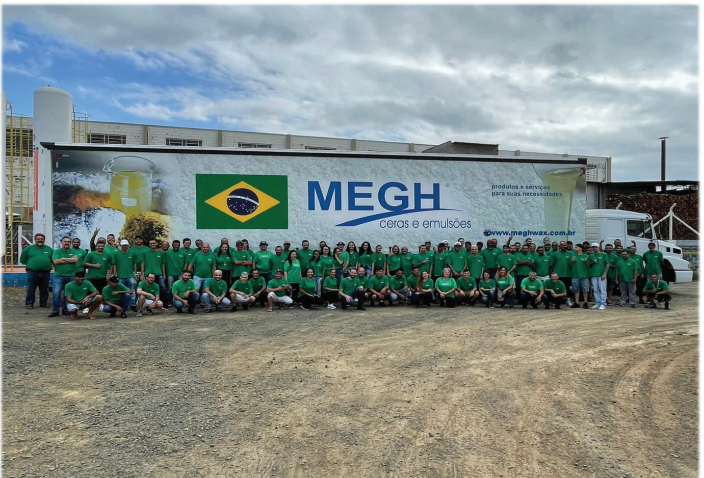
Porto Feliz – São Paulo – Brasil